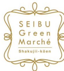
「SEIBU Green Marché」 ロゴ