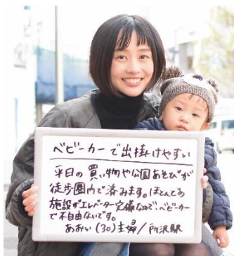
「SEIBU GRAFFITI」VOL.2内のコーナー「SEIBU VOICE」より