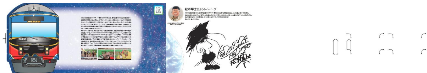
「通常版」台紙（中面・乗車券セット）

©Leiji Matsumoto, SEIBU Railway Co.,LTD.