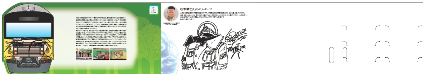
「練馬版」台紙（中面・乗車券セット）