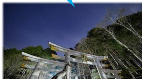
(画像は過去のイメージです)