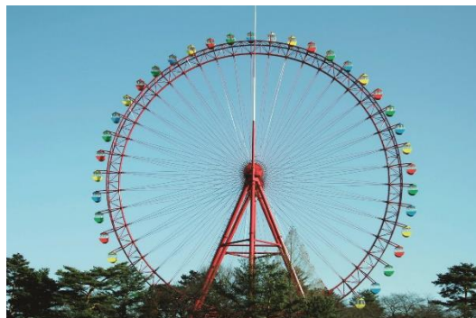
西武園ゆうえんち