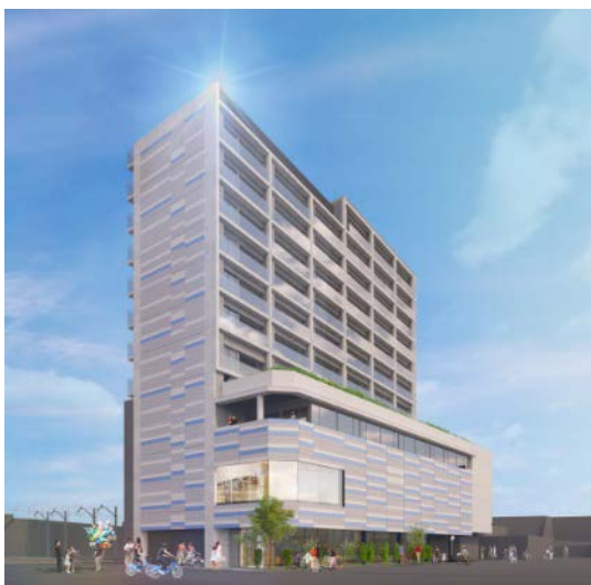
「エミライブ東長崎」外観