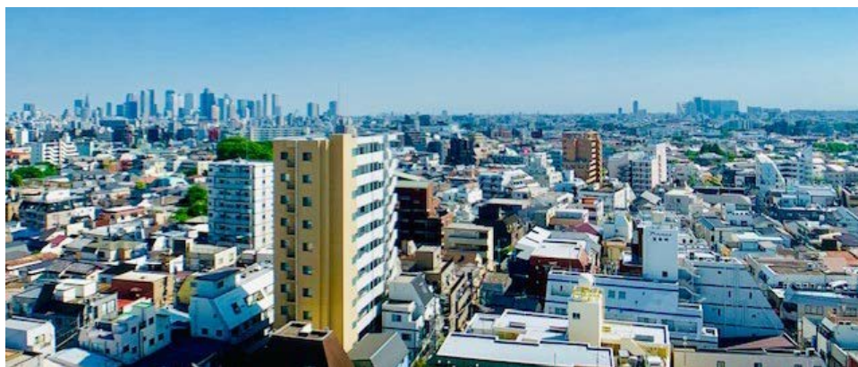
「エミライブ東長崎」高層階からの眺望

物件(募集)ホームページ▶ http://www.emilive.jp/higashi-nagasaki/ ※公開は6月28日(金)予定