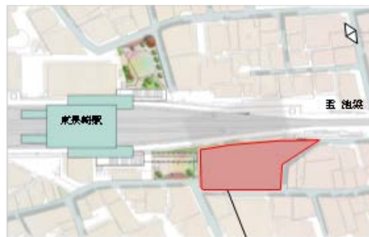
「エミライブ東長崎」