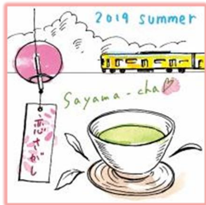
<狭山茶 1袋>※画像はイメージです。

ステップ2 パンフレットに付いている「クーポン券」を、本川越駅直結の西武本川越ペペ1F「西武プリンスクラブカウンター」へお持ちいただいた方全員に、恋さがしキャンペーンオリジナルパッケージ「狭山茶」1袋（ドリップタイプ）をプレゼント。