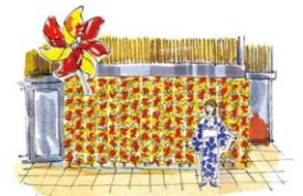
風車スポット(イメージ)