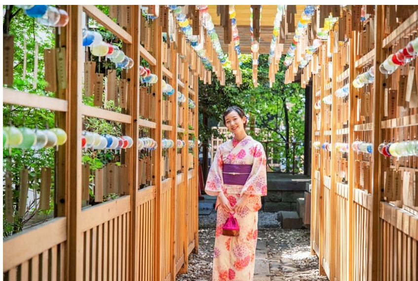
川越氷川神社 縁むすび風鈴&恋あかり