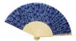
「扇子」※画像はイメージ

※西武鉄道での「恋さがし」キャンペーン(狭山茶プレゼント)および館内の一部装飾のみ、7月27日(土)より実施。