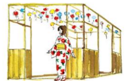
川越氷川神社「縁むすび風鈴」を再現(イメージ)