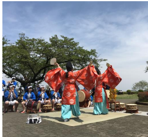
皆野民俗芸能奏楽研修会 少年部