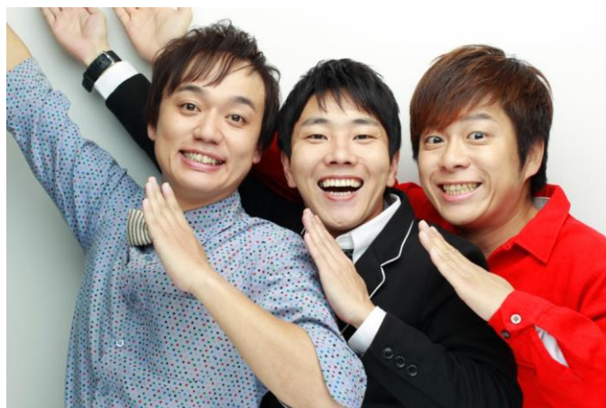
ななめ 45° さん