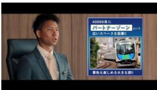
3. すべてに西武鉄道社員がアドリブで回答