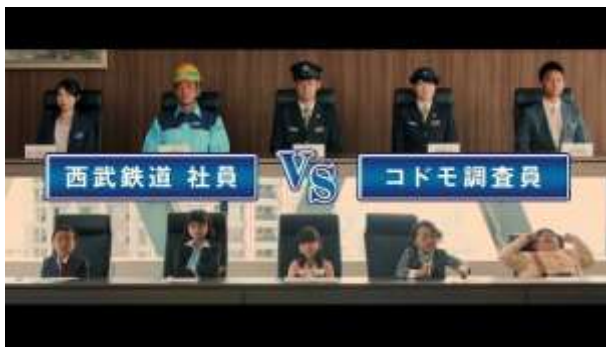
1. 「西武コドモ会議」スタート