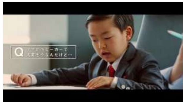
2. コドモ調査員からの質問の数々…