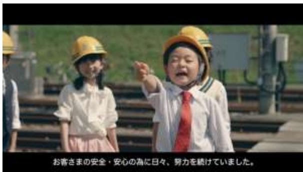
5. コドモ調査員が「安全・安心」を実際に体験