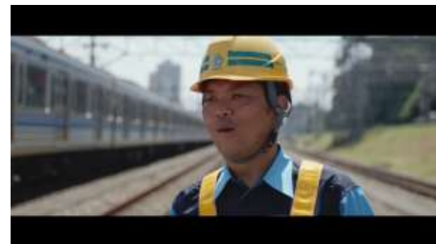
6. こどもたちのパワーに圧倒されました！