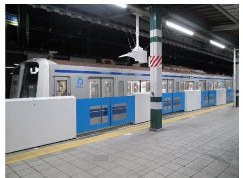
練馬駅ホームドア設置の様子 (1 番ホーム)