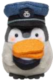
わらじかつコウペンちゃん

秩父地域で人気のソウルフード、「わらじかつ井」をかかえた駅員コウペンちゃんです。大きいわらじかつがキュート。