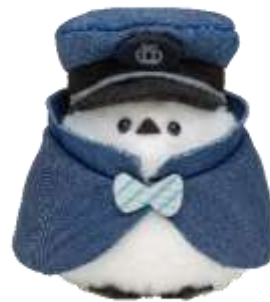
駅員 よこシマ 邪 エナガさん

秩父地域で人気のソウルフード、「わらじかつ井」をかかえた駅員コウペンちゃんです。大きいわらじかつがキュート。