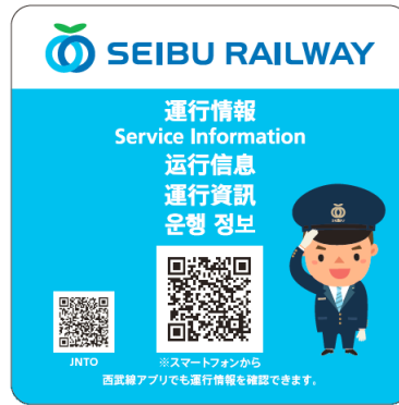
ステッカーデザイン