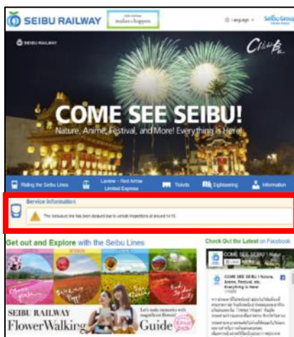
多言語 Web サイト TOP ページ（英語）