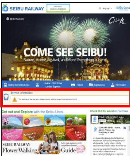
多言語 Web サイト TOP ページ (英語) (運行情報は赤枠部分)

韓国語 https://www.seiburailway.jp/railways/tourist/korea/railwayinfo/index.html