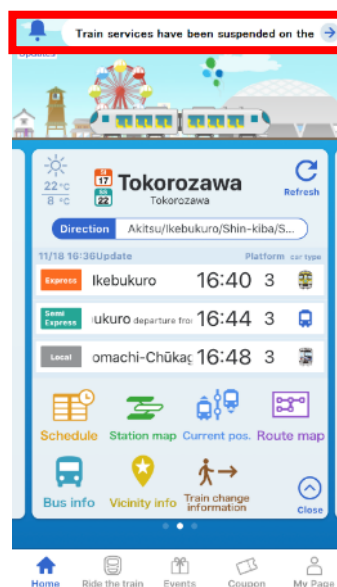
西武線アプリ（英語）