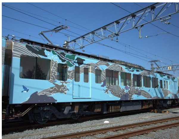
2号車：「夏」秩父の山の緑