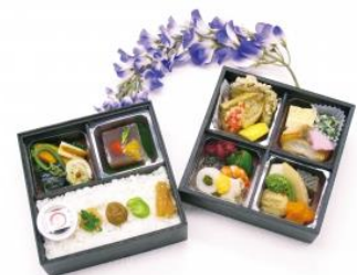
【限定お弁当のイメージ】