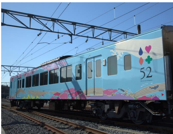
1号車：「春」芝桜、長瀨の桜