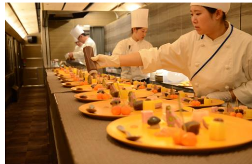
3号車（料理はイメージ）