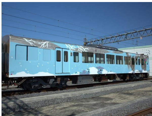
4号車：「冬」あしがくぼの氷柱