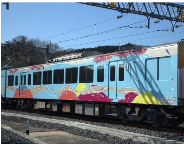
3号車：「秋」秩父連山の紅葉