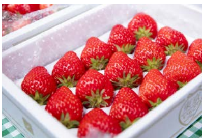
毎年大好評のいちごの販売も実施!

次回の「SEIBU Green Marché」は、7月に開催予定です。練馬区をはじめ、西武線沿線の自然が生み出す旬の“おいしい”出会いに、ぜひお出かけください。詳細は、別紙のとおりです。