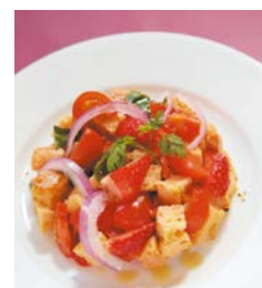
まちバル スペシャルメニュー