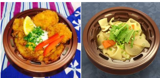
【左】 秩父わらじ豚味噌丼(ミニサイズ)