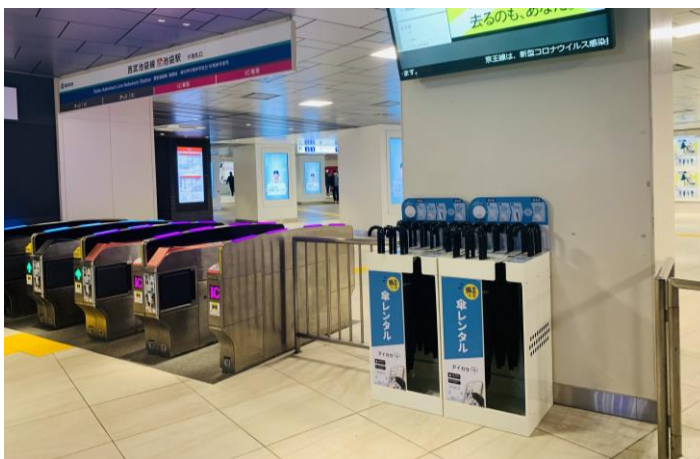
傘立て設置の様子(池袋駅)

この度の設置拡大により、沿線にお住まいのお客さまのさらなる利便性向上に加え、電車内・駅構内での傘のお忘れ物の削減、それにともない廃棄されるビニール傘の数の削減を通じて、環境の保護においても貢献してまいります。