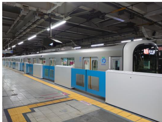
所沢駅ホームドア設置の様子 (1番ホーム)

当社では、今後もホーム上の安全確保に鋭意取り組んでまいります。 詳細は、以下のとおりです。