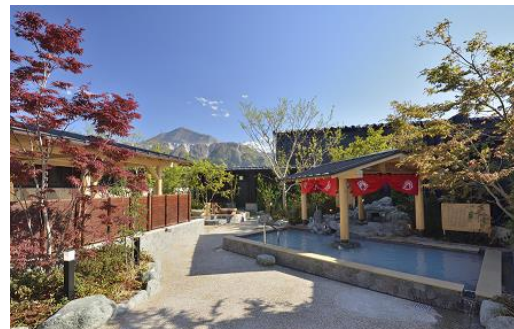
西武秩父駅前温泉 祭の湯 露天風呂(女湯)