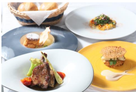
ブランチコースメニュー(2020年10月~12月)