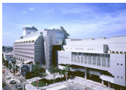
川越プリンスホテル