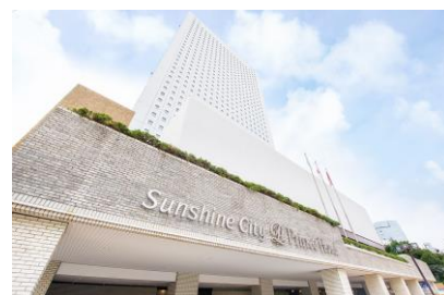
サンシャインシティプリンスホテル