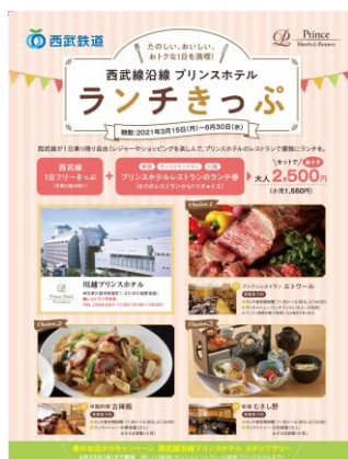
パンフレット表紙