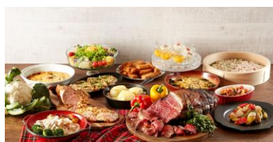
川越プリンスホテル buffetレストラン エトワール ランチbuffet