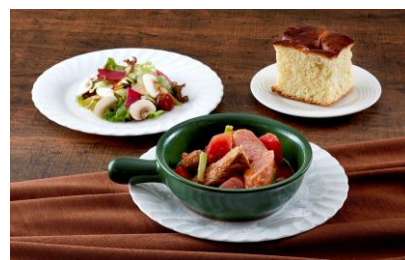
サンシャインシティプリンスホテル カフェ&ダイニング Chef's Palette マルミットセット