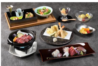
新宿プリンスホテル 和風ダイニング&バー FUGA(風雅) GOZEN ランチ