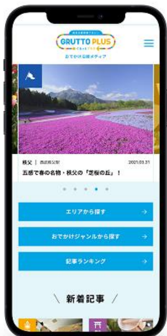
モバイルサイトイメージ