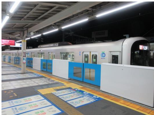
高田馬場駅ホームドア設置の様子 (3番ホーム)

当社では、今後もホーム上の安全確保に鋭意取り組んでまいります。 詳細は、以下のとおりです。