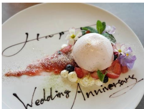
デザートプレート イメージ