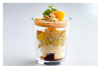
至福のモンブラン (2021年11月から)

※「Anniversaryプラン」「スペシャルデザート」につきましては、ランチコースまたはディナーコースのご予約時に同時にお申込ください。ランチコースまたはディナーコースをご予約済みで、オプションメニューをご希望のお客さまは、ご乗車日の一週間前までに予約完了メールの宛先に【ご予約日・お名前・追加希望の内容】をお送りください。