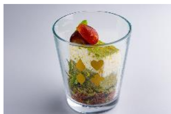
至福のドゥーブルチーズケーキ (2021年10月まで)