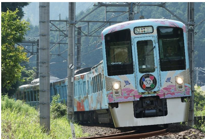
西武 旅するレストラン「52 席の至福」

※ 新型コロナウイルス感染症の感染拡大の状況によっては、企画のすべてまたは一部の中止・変更が生じる可能性があります。