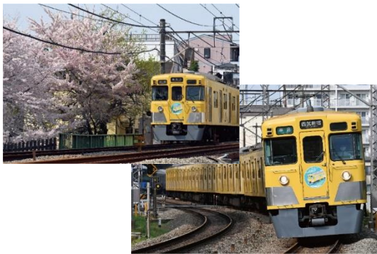
ポストカード(2柄各1枚)