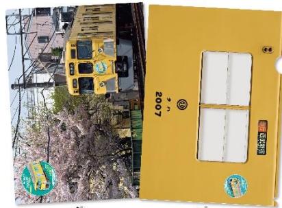
A4クリアファイル(A) (1点)