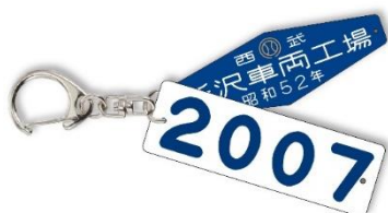
車番銘板キーホルダー(A) (1個)