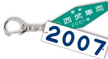
車番銘板キーホルダー(B) (1個)