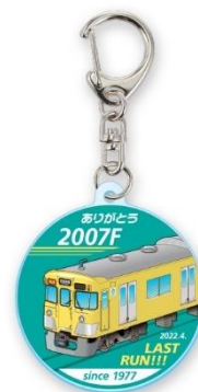
ロゴマークキーホルダー(1個)