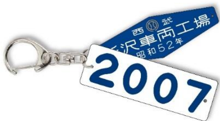
車番銘板キーホルダー(A)