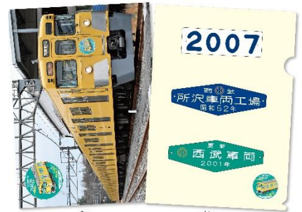
A4クリアファイル(B) (1点)

新型コロナウイルス感染拡大防止の観点からお客さまや従業員の安全を配慮するため、以下につきましてお客さまのご理解とご協力をお願いいたします。