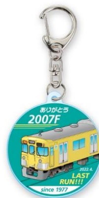
ロゴマークキーホルダー