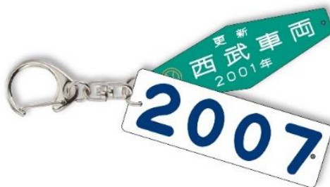
車番銘板キーホルダー(B)