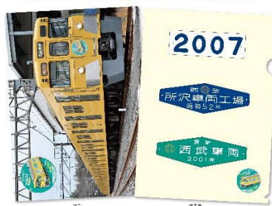
A4 クリアファイル(B)(1点)