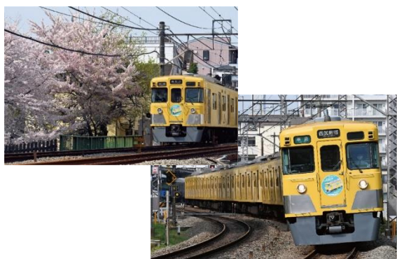
ポストカード(2柄各1枚)