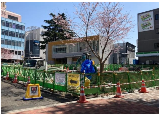
豊島園駅 駅前広場(工事中)