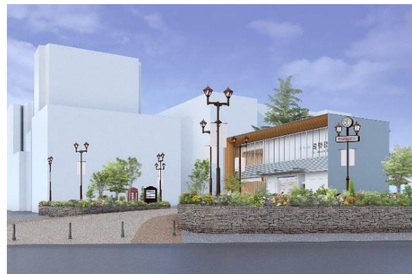
豊島園駅 駅前広場 完成イメージ