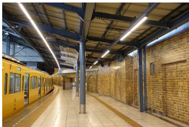
池袋駅 1番ホーム（工事中）