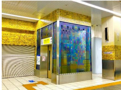
エレベーター ステンドグラスデザイン