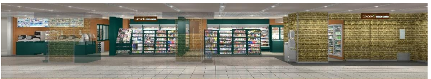
トモニー池袋駅1階改札内店 イメージ