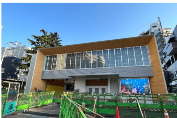
豊島園駅 新駅舎（工事中）