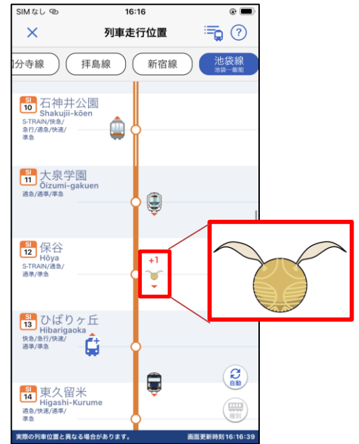
列車位置画面イメージ

アイコンになっている「ゴールデンスニッチ」は、映画「ハリー・ポッター」に出てくる、魔法界のスポーツ「クィディッチ」で使用される羽で飛ぶボールです。このボールを捉えたチームは高得点を得ることができる貴重なアイテムです。