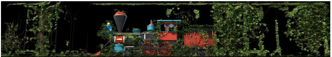
《春 昼 Ver.》