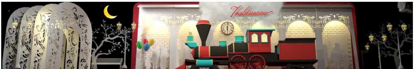
《春 夜 Ver.》