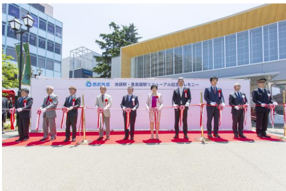
リニューアル完成セレモニー テープカット

引き続き西武鉄道では、沿線自治体ならびに「ワーナー ブラザース スタジオジャパン合同会社」とともに、豊島園駅周辺エリアの活性化に取り組んでまいります。