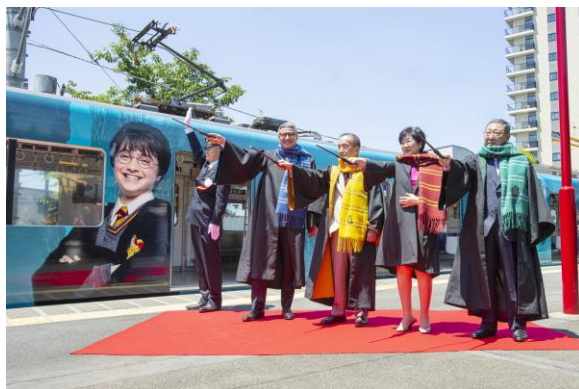
「スタジオツアー東京 エクスプレス」出発式