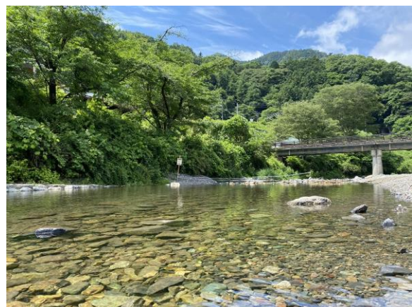
自然あふれる横瀬町