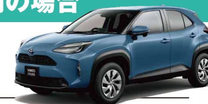
※画像はヤリスクロス(SUV2クラス・5人乗り)です。

※ご利用日の2日前までに事前予約が必要です。予約状況によりご利用いただけない場合があります。