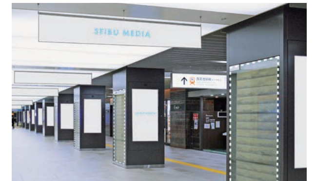
C-2エリア(地下改札外)※側面ラッピング(ガラス面)・横断幕セットイメージ