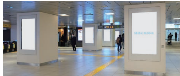
Aエリア(地上改札内)