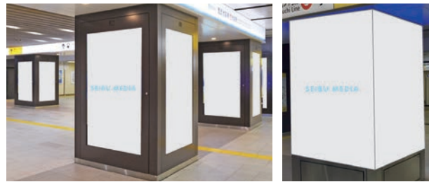
C-1エリア(地下改札外)