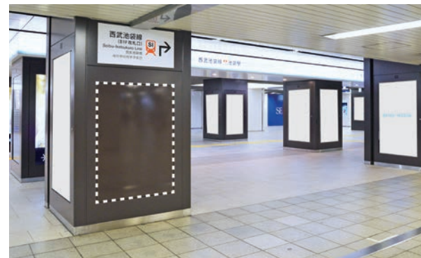
C-1エリア(地下改札外)※B0シートイメージ