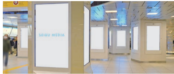
B-2エリア(地上改札外)