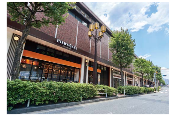
西武新宿駅高架下の商業施設「Brick St.」