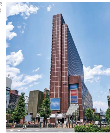
西武新宿駅 (新宿プリンスホテル)