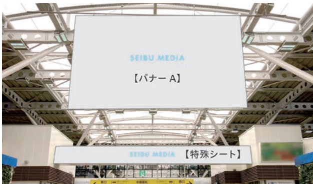
所沢バナーA、所沢特殊シート