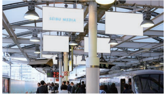
西武新宿フラッグ