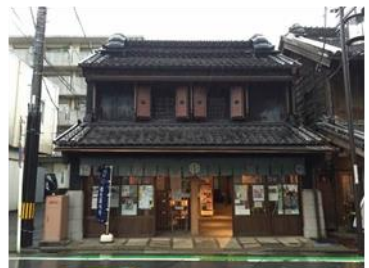
仲町觀光諮詢處 外觀