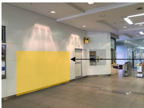
祈願繪馬板的設置預定處

「西武鐵路xLAIMO 活動」的祈願繪馬板設置於本川越站二樓剪票口內的大廳，旅客可在出示指定車票所獲贈的祈願繪馬貼紙上寫下心願，並貼在祈願繪馬板。