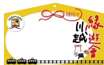
限定紀念品（祈願繪馬貼紙） ※概念圖