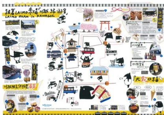
「特製緣遊地圖」（內頁） ※概念圖