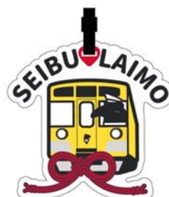
限定紀念品（行李吊牌） ※概念圖