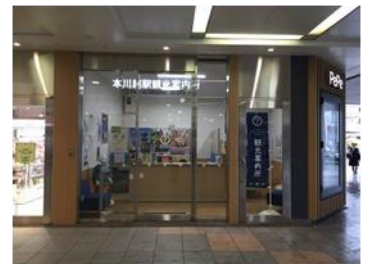
本川越站觀光諮詢處 外觀