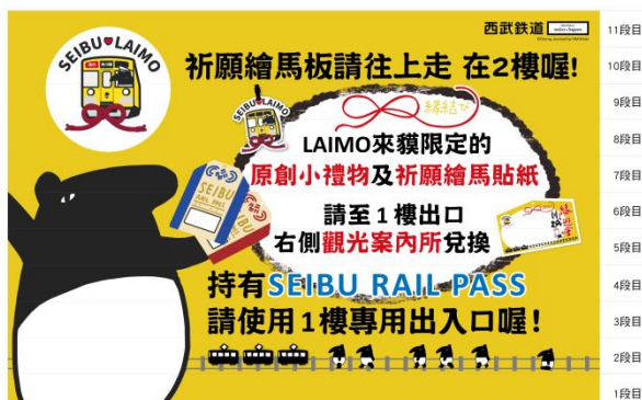
樓梯貼圖的設計（概念圖）