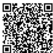
特設網站 QR Code

（URL： http://www.goodlucktripjapan.jp/special/seibu-laimo/ ）