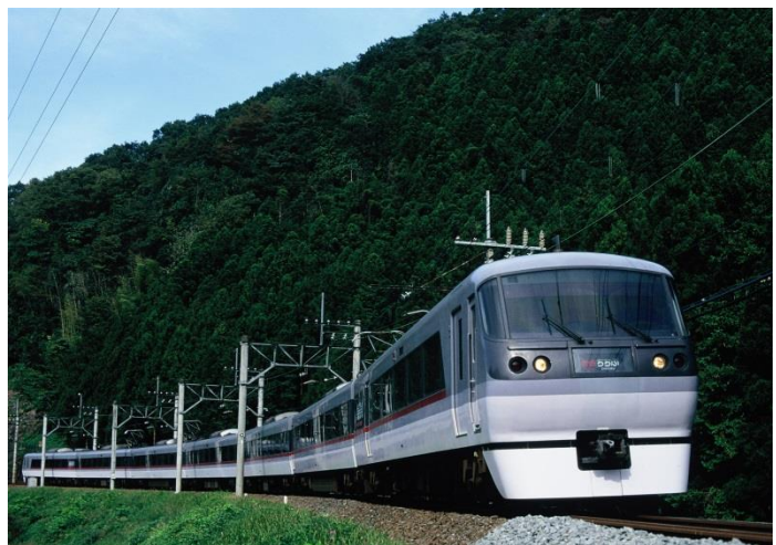
特快 Red Arrow 號