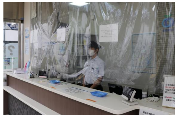
ビニールカーテンの設置 (お客さまご案内カウンター)