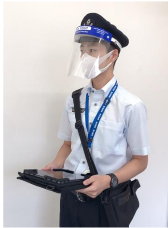
車内ご案内係員のフェイスシールド着用