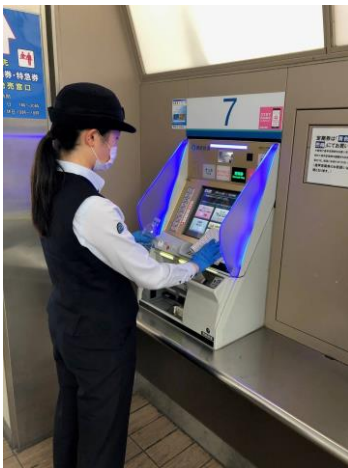
駅設備の消毒(券売機)

https://www.seiburailway.jp/safety/offpeak/index.html